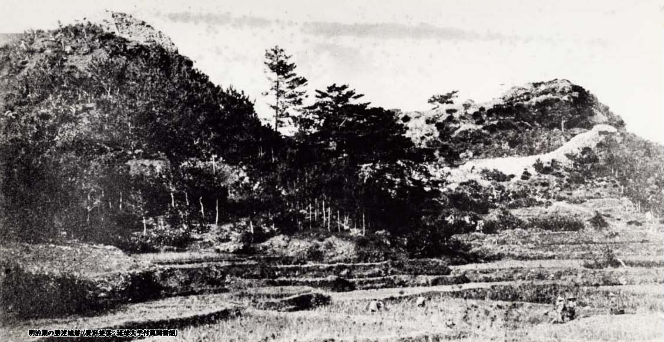
明治期の勝連城跡